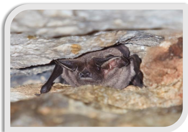
Figure 2 : Molosse de Cestoni et Vespère de Savi

Plusieurs espèces sont susceptibles de fréquenter les falaises, mais deux sont tout particulièrement inféodées au milieu rupicole, il s'agit du Molosse de Cestoni et du Vespère de Savi.